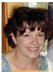
Par Denise Papineau

Une bonne équipe de travail génère une énergie étonnante, accessible à toute organisation qui se donne les conditions gagnantes pour y accéder. Le premier pas est d'avoir la volonté de passer de la situation actuelle à la situation désirée et de l'assumer en tant que leader.