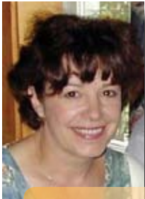
Par Denise Papineau