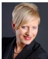
Présidente-directrice générale C.O. organisationnel, CRIA

De façon générale, nous pourrions dire que le coaching favorise l'identification d'une situation désirée par le coaché, les prises de conscience par rapport à la situation actuelle, l'ouverture des possibilités et le passage à l'action vers la situation désirée. En tant que principal acteur dans cette démarche, le coaché découvre qu'il a des ressources et le pouvoir de changer les choses et développe ou apprend de nouvelles façons de faire par rapport à la situation donnée. Il peut même arriver à appliquer cette démarche à d'autres situations et ainsi « s'autocoacher ».